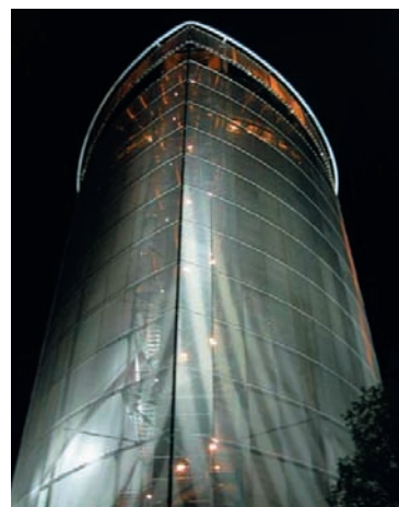
Arctura i Östersund, arkitekt: Sweco belysning: Ljusdesign