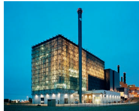
Tekniska verken i Linköping arkitekt: Berg arkitektkontor